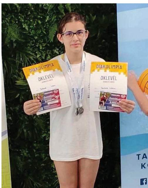
Bakos Lilien két ezüstéremmel